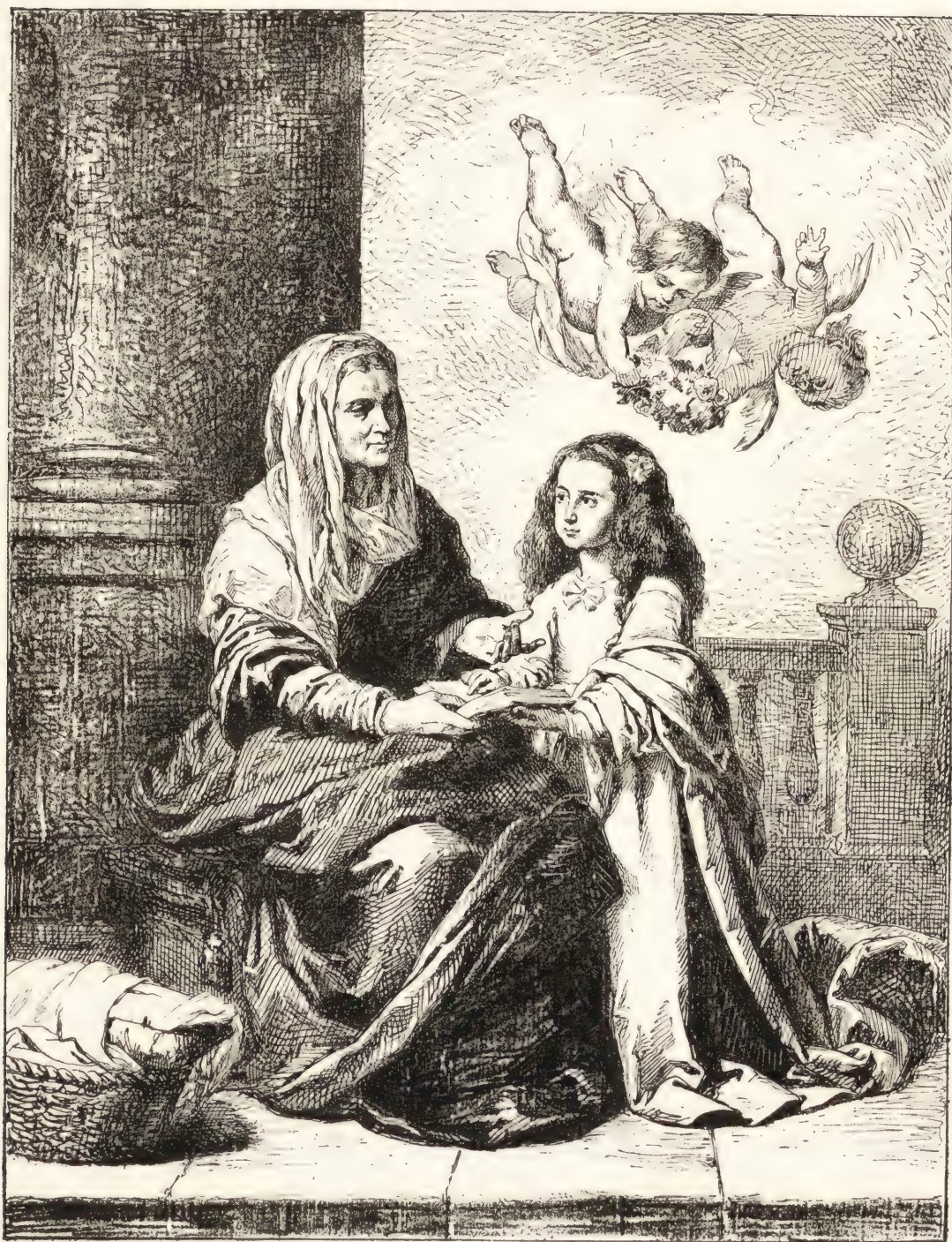
ÉDUCATION DE LA VIERGE. (Musée de Madrid.)